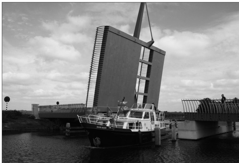
Neue Brücke bei Gorredijk.