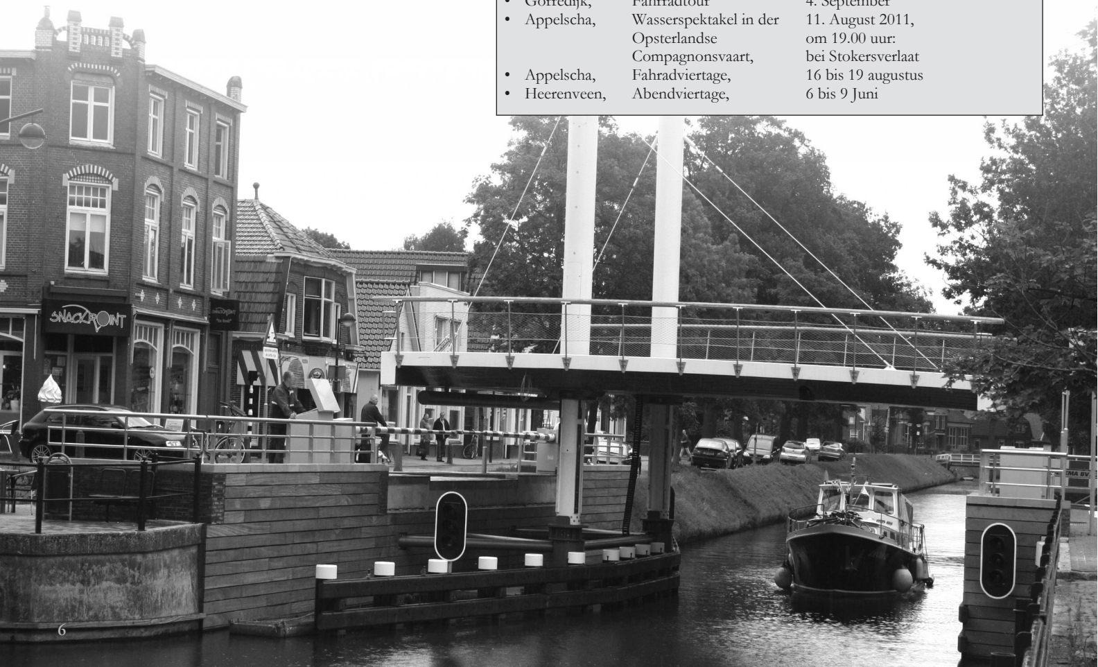
Neue Brücke in Oosterwolde.